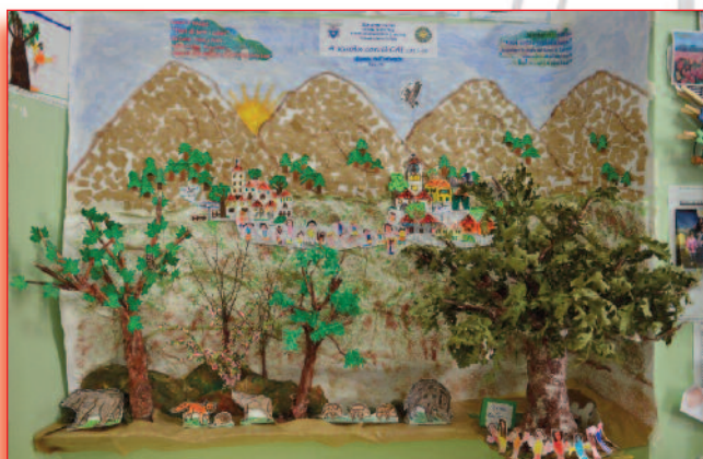
"A scuola con il CAI" 2015-2016 il grazie dei bambini dell'infanzia dell'I.O. di Amatrice