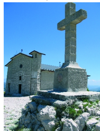
Leonessa, Colle Collato, Chiesa

Il quarto centenario della morte, che ricorre proprio quest'anno, di san Giuseppe da Leonessa - un umile frate cappuccino che con il suo forte spirito umanitario è stato uno dei personaggi più significativi dell'opera di sostegno ai poveri tra il sec. XVI e XVII, che ha promosso i Monti di Pietà e soprattutto i Monti Frumentari - ci dà l'opportunità di riflettere sul tema di una economia giusta, ossia sul "sapore buono del denaro". Proprio l'attuale crisi dell'economia ci esorta a riflettere se il modo di guardare al denaro è quello giusto e se non si richiede a tutti di cambiare ottica.